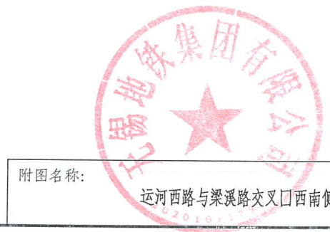
附图名称：运河西路与梁溪路交叉口西南侧地块与地铁2号线平面关系